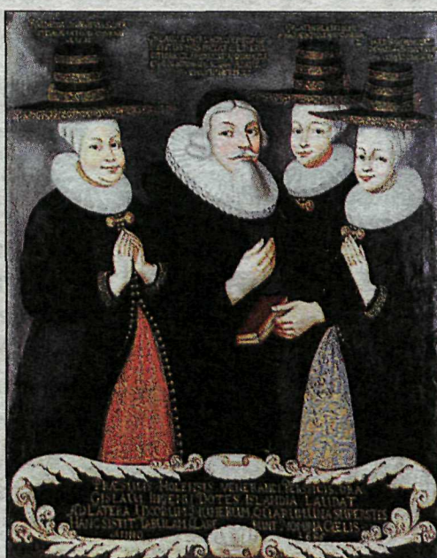
BLENDINGAR FYRRI ALDA: Tvöföld afmælisýning í Listagilinu.