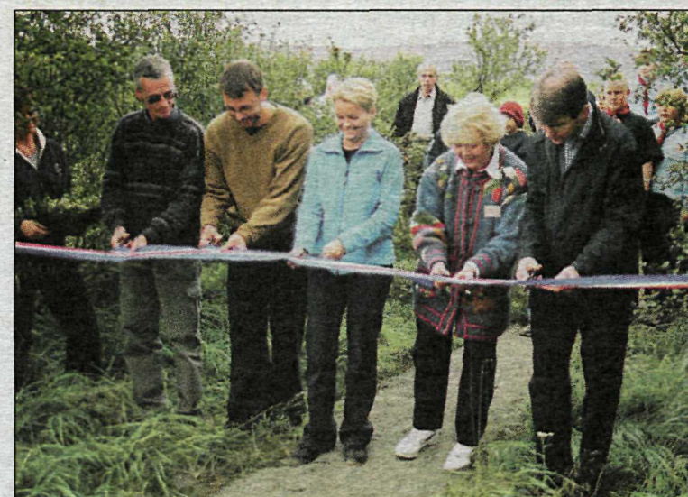
KLIPPT Á BORÐANN: Vigdís Finnbogadóttir, fyrrverandi forseti Íslands, og fulltrúar verkefnisins klippu á borðann.