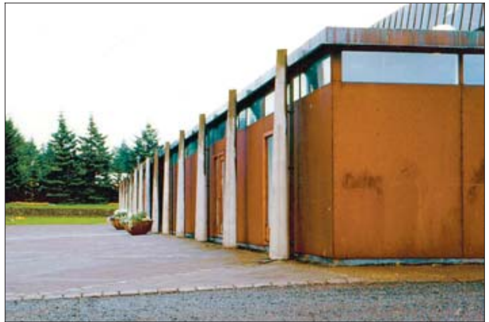
Myndlistarhúsið á Miklatúni. Kjarvalsstaðir voru vígðir formlega árið 1973.

Síðan vildum við fagna tímamótunum með sýningu sem væri ekki hefðbundin listsýning, heldur stiklur úr sögu Kjarvalsstaða, því það er ekki fyrir en maður fer að líta yfir úrklippusafnið sem maður gerir sér grein fyrir því hvað þetta hefur verið gífurlega mikið starf. Hér hafa verið vel á fimmta hundrað sýninga, auk fjölda annarra viðburða, svo sem leiksýninga, tónleika, danssýninga, borgarafunda, alþjóðlegra ráðstefna, kosninga – osfrv. Lengst af sínum tíma, og vonandi enn í dag, má líta á Kjarvalsstaði sem fjölþætta