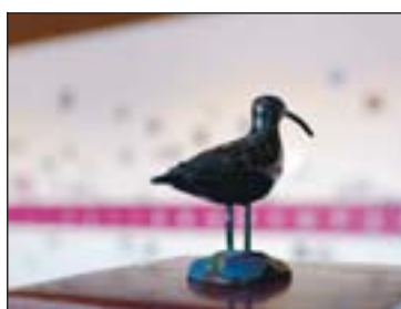
Mynd nr. 6