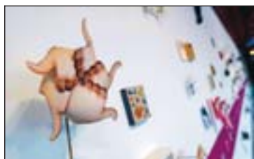
Mynd nr. 5