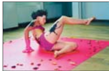
Mynd nr. 3

1) Ferðafuða í Slunkaríki á Ísafirði þar sem ferðin hófst haustið 2001. 2) Sýningin komin til Akureyrar sumarið 2002. 3) Framlag Önnu Richardsdóttur til Ferðafuðu var gjörningurinn Pöddur. 4) Frá sýningunni í Ketilhúsinu á Akureyri. 5) Samtals taka 162 myndlistarmenn þátt í Ferðafuðu á Kjarvalsstöðum. Fremst á myndinni má sjá verkið Thumbs up – thumbs down eftir Heklu Dögg Jónsdóttur. 6) Án titils eftir Sólveigu Baldursdóttur er eitt þeirra verka sem sjá má á Kjarvalsstöðum.