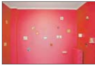
Mynd nr. 1