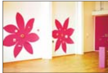
Mynd nr. 2