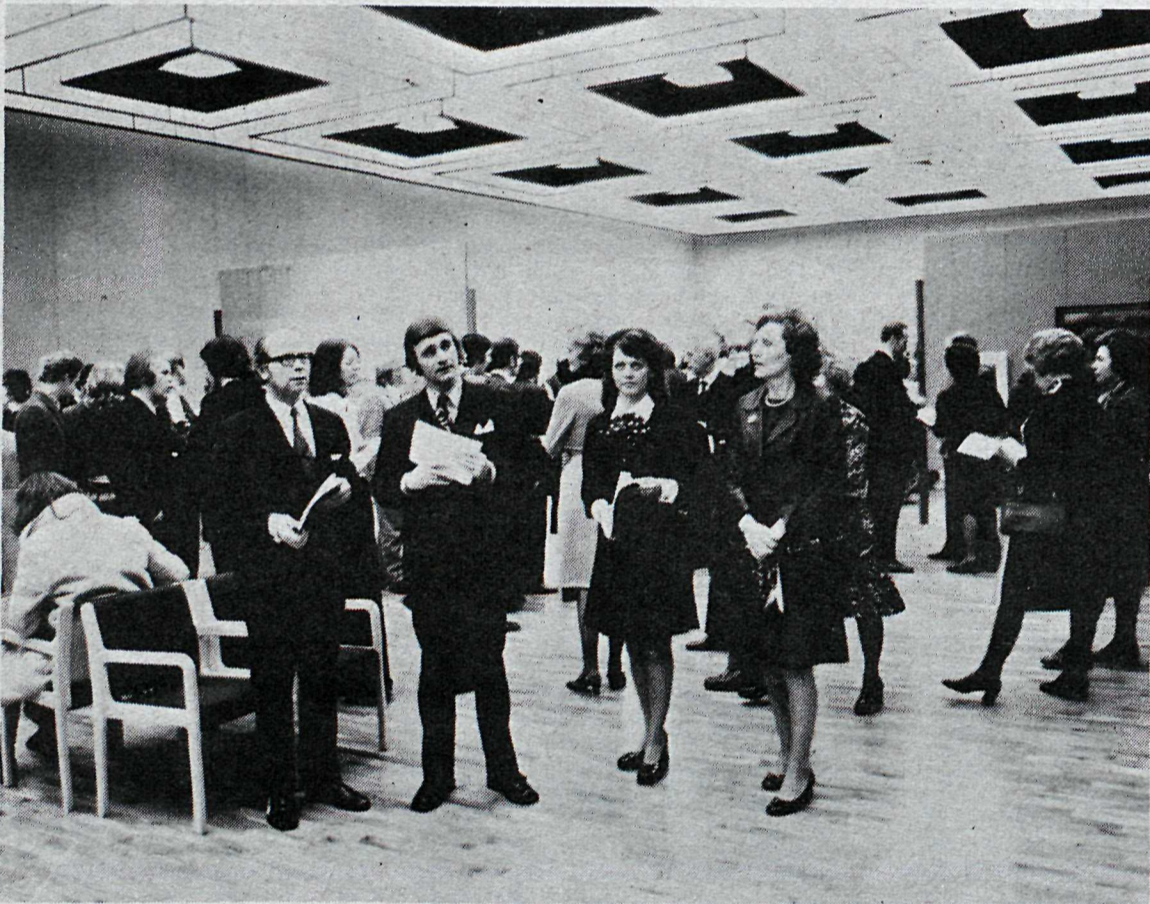
Borgarstjóri og forseti Íslands virða fyrir sér myndirnar á sýningunni.