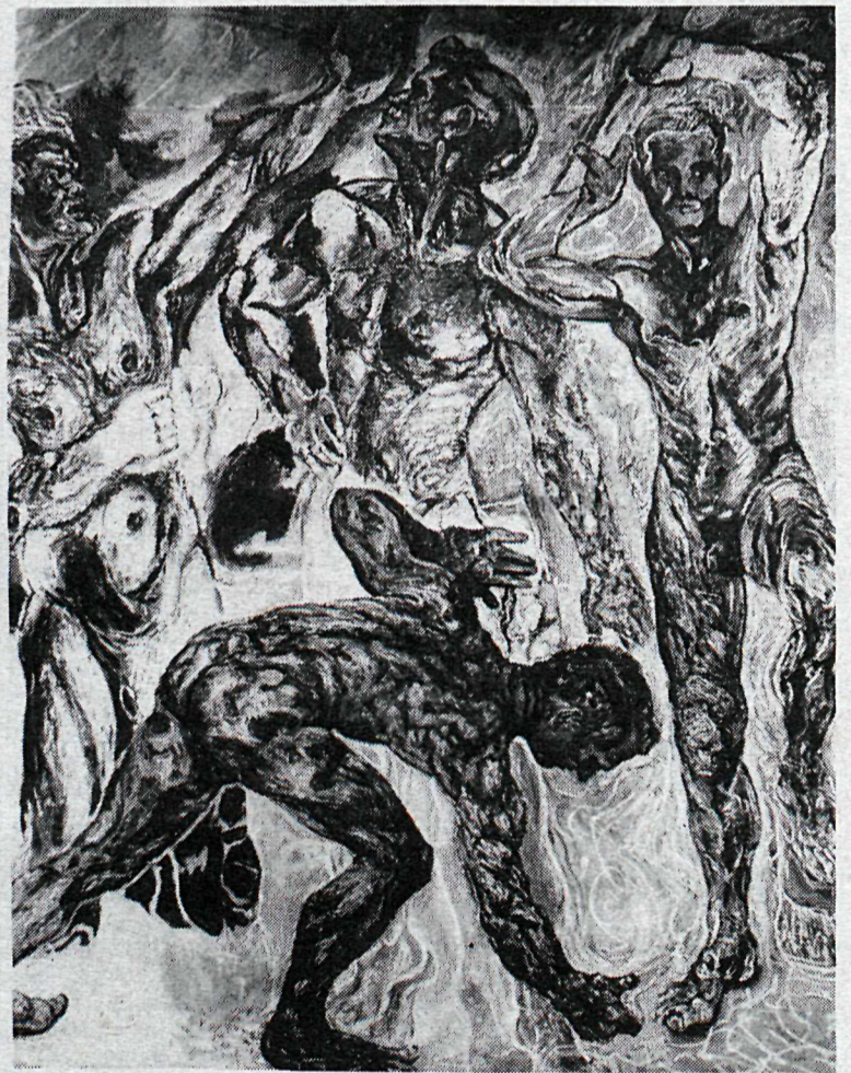
Eitt verkanna á sýningunni.