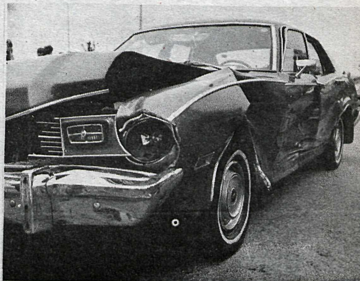
Bíllinn er kom Stakkahlíðina (t.v.) og leigubíllinn (t.h.). Asamt þeim skemmdust tveir aðrir fólkabílar í þessum mikla árekstri.