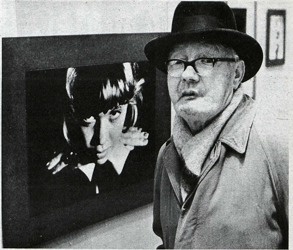
Þau sóma sér vel saman þessi tvö, eða hvað?