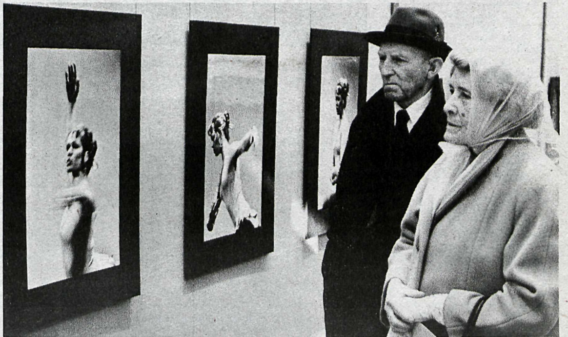
Það er munur að geta teygt sig svona, virðast þau hugsa. Já, hvað skyldi þetta nú vera?

tveim, þó að skoðanir væru skiptar eins og gengur. Anægjan skein út úr hverju andliti, hvort sem skoðaðar voru hrikalegar landslagsmyndir eða ljósmyndir af borgarlífinu. Það er ábyggilega ekki hægt að fá áhugasamari gesti en gamla fólkið og ætti að gera miklu meira af því að bjóða því á sýningar í höfuðborginni heldur en verið hefur.