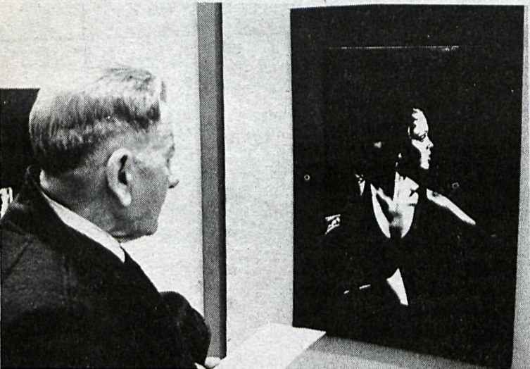
Hvað skyldi hún vera að gera þessi?

sagði maður nokkur, sem stóð og skoðaði verk meistarans með mikilli athygli. Þeir voru margir, sem höfðu sömu skoðun og hann, en sögðu, að það væri gaman að skoða ljósmyndirnar, þótt þeir tækju nú málverkasýningar fram yfir.