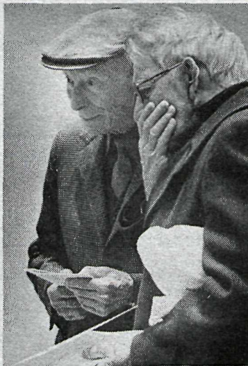
Þessir tveir velta öldnum vöngum yfir sólarlagsmynd úr Arnarfirði.