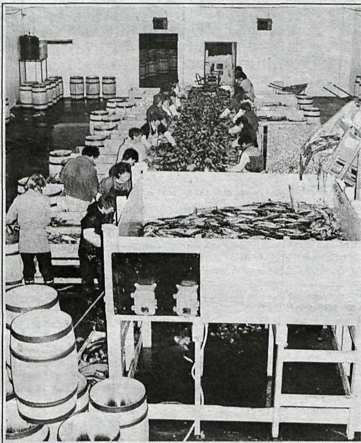
Frá síldarsöltun á Reyðarfirði.

Ljóst er því að mikið liggur við að ná samningum við Sovétmenn hið fyrsta, en það er jafnframt ljóst að sjaldan eða aldrei hafa samningaviðræður dregist jafn lengi og sjaldan hefur samningsaðstaða okkar verið jafn þröng. Norðmenn og Kanadamenn hafa undirboðið Suðurlandssíldina verulega á okkar helstu mörkuðum og er þess skemmst að minnast að umtalsvert bakslag kom í viðræður við Svía og Finna fyrir skömmu vegna undirboða Norðmanna á elleftu stundu. Síldarsaltendur eru nú einnig mjög varkárir eftir óskemmtilega reynslu í fyrra þegar stórtap varð á síldarsöltun, og telja þeir sig ekki geta greitt mjög hátt verð fyrir síldina án þess að til komi veruleg