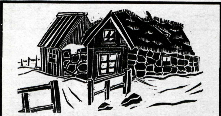
Fyrstu íslensku fréttamyndirnar.