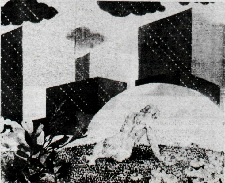
Fíring Jóhönnu Bogadóttur. Æting og akvatinta. Myndin er gerð á þessu ári.