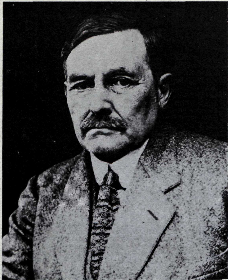
„Einar Benidiktsson“ 1935