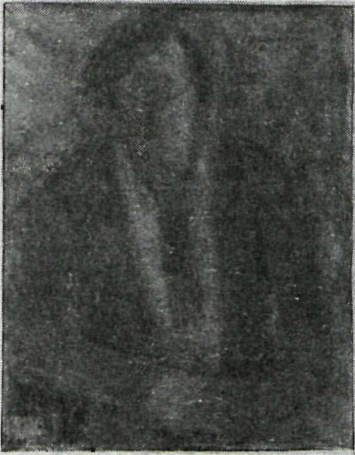
Ein af myndum Agústs F. Petersens, dæmigerð fyrir manna-myndir hans.