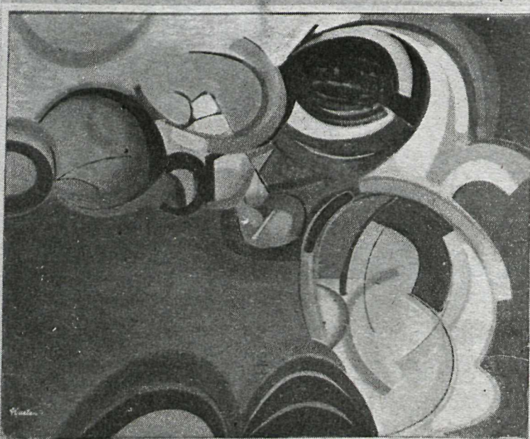
Olíumálverk eftir Kjartan Guðjónsson

Þessi myndgerð er orðin dálitð þreytandi að visu, en þessar þrjár litlu myndir eru í sérflokki.