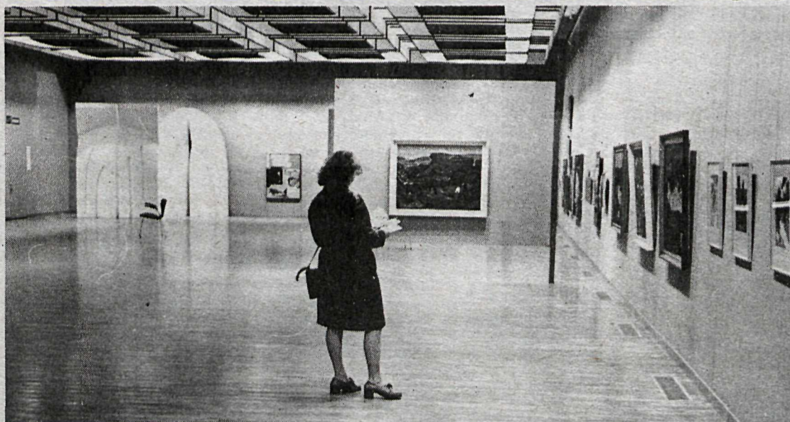
Séð yfir annan sýningarsalinn á Kjarvalsstöðum.

Góð aðsókn hefur verið að Haustsýningu FÍM að Kjarvalsstöðum og fjöldi verka selst. Þeirri nýbreytni að hafa tónleika og kvikmyndasýningar hefur verið tekið mjög vel og láttlaus aðsókn verið að kvikmyndasýningunum.