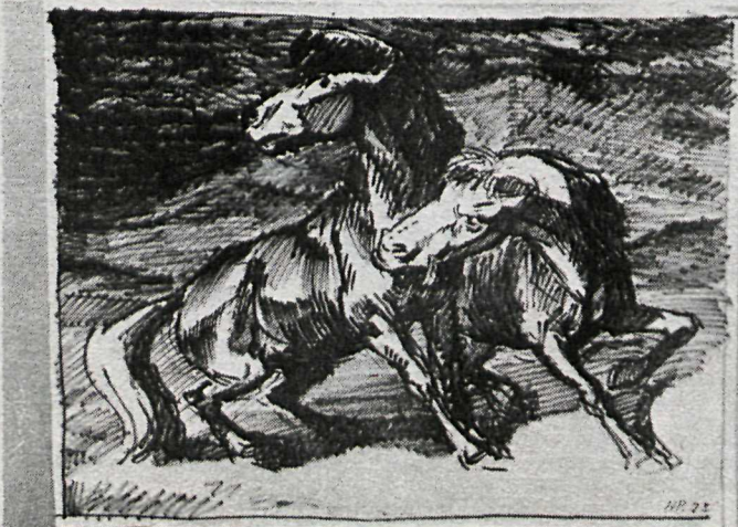
Hestamyndir eru margar á sýningu Halldórs Péturssonar.