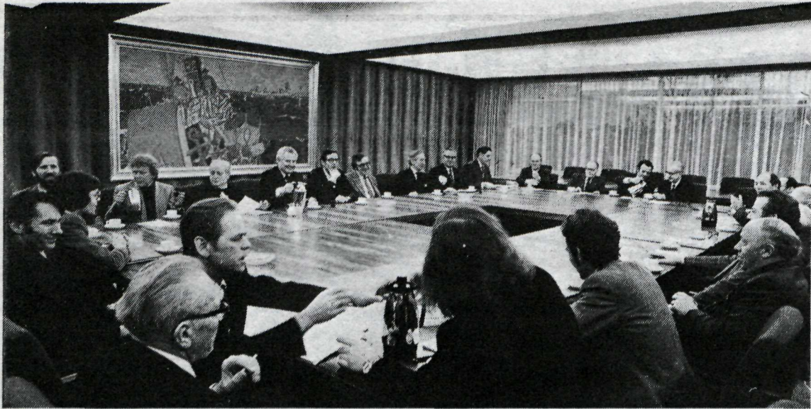
Frá fyrsta samningafundi Alþýðusambands Íslands, Vinnuveitendasambands Íslands og Vinnuálagssambands samvinnufélaga í gær.