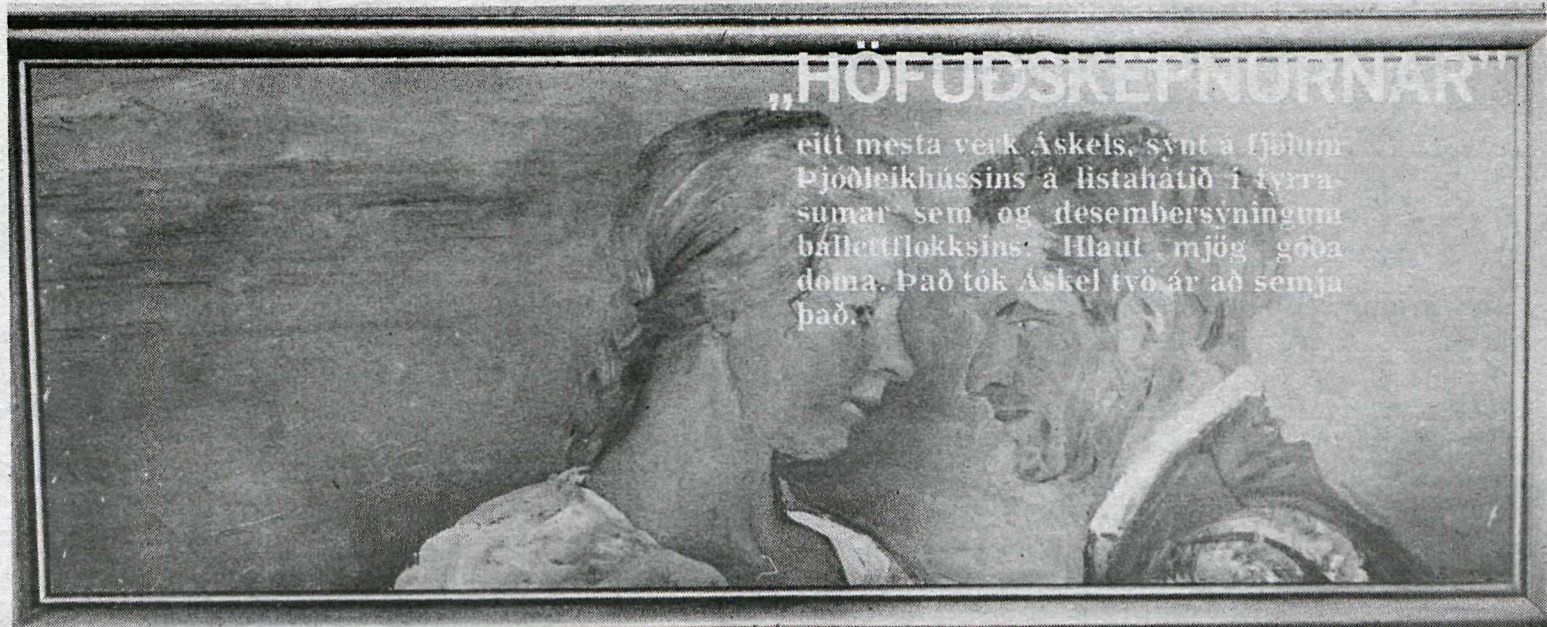
Yndislegt er úti vor (frá 1926)