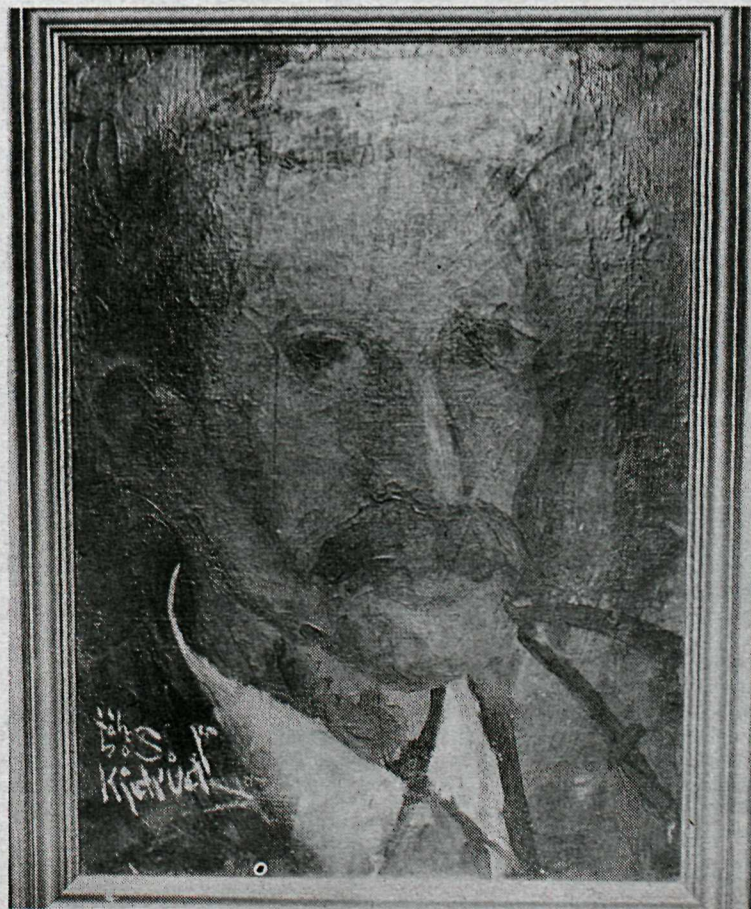
Mynd af Guðmundi Davíðssyni