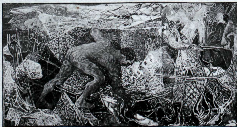
Ein stærsta mynd Kjarvals, Sól og sumar. Frá Þingvöllum.