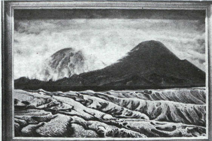
Granni í garð, ein af myndum Guðna Hermansen — sýnir Eldfellið og Helgafell, tvíburana sem fæddust með 5000 ára millibili.

Þetta er snotur sýning hjá Guðna og frágangur hverrar myndar fyrir sig til fyrirmyndar. Vel gert við hvert verk og hvergi sparað til við innrömmun og annað. Snyrtimennska mikil er í öllum vinnubrögðum, en stundum