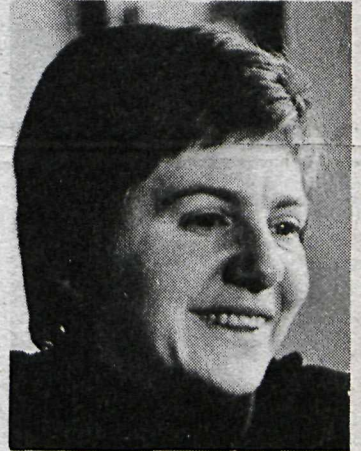
„Auðvitað tek ég yfirleitt mest mark á minni eigin krítík...“

„Ég var orðin 18 eða 19 ára þegar ég loksins tók ákvörðun um að gera alvöru úr þessu. Ég hafði í nokkur ár eftir skólann verið í hálfgerðu millibilsástandi. Var svona að athuga minn gang. En svo tók ég ákvörðun og fór að ganga í kvöldskóla í Myndlistarskólann í Reykjavík. Þar kenndi mér