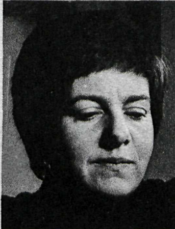
„Að verðleggja myndirnar mínar er það leiðinlegasta sem ég geri...“

„Ég geri mér nú satt að segja ekki grein fyrir því hvenær eða hvernig myndlistaráhuginn kviknaði. Ég held ég hafi haft gaman af því að krota frá því ég man eftir mér, en það leið langur tími þar til ég tók ákvörðun um að fara alveg út í þetta. Ég átti ósköp ágæta og góða barnæsku hér í austurbænum í Reykjavík, en það var ekki