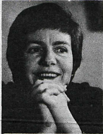
„Ég held að það færi oft ekki vel fyrir grautarpottunum ef ég ætti að sjá um þá og mála...“

ast fyrr en á staðnum og stundinni. Ég hugsa að fyrir þessa sýningu muni ég hafa smá skírnarathöfn á undan opnuninni. Ég fæ oftast nokkra kunningja og vini til að hjálpa mér við nafngiftir. Þótt ég sé sjálf búin að gera mér allt abra hugmynd er oft skemmtilegast þegar nöfnin koma frá fólki sem sér myndirnar í fyrsta skipti og fær spontant hugmynd. Hvað myndefnið áhræfir er það jú rétt að ég geri dálítið af því núna að hræra saman fornaldarmótívum og nútímahlutum. Ég held reyndar, að það sé ekki svo mikið bil