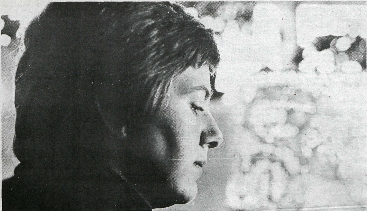
„Gangurinn er nú einu sinni sá að maður verður að losa sig við myndirnar til að hægt sé að halda áfram...“