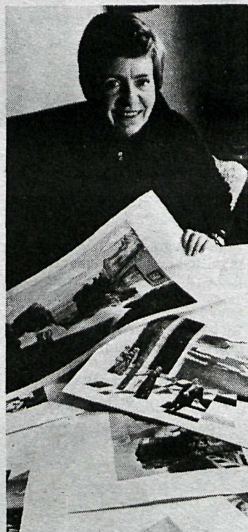
Þorbjörg á kafi í skýssunum eða smámyndunum sem málverkin spreitta svo upp úr.

takinu í einu, hleyp úr einni í aðra, og þess vegna gerir maður sér ekki grein fyrir hversu mikill tími fer í hverja. Mér finnst líka mjög erfitt að vita hvenær á að stoppa. Hvenær maður er farinn að ofvinna myndina. Oft er það þannig að ég legg mynd til hliðar til að hvíla mig á henni, en kem svo ekkert að