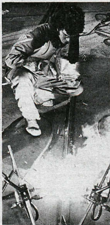
Íslenskur iðnaðarmaður að störfum.

Þá er ráðgerð matvælakynning Framhald á bls. 18