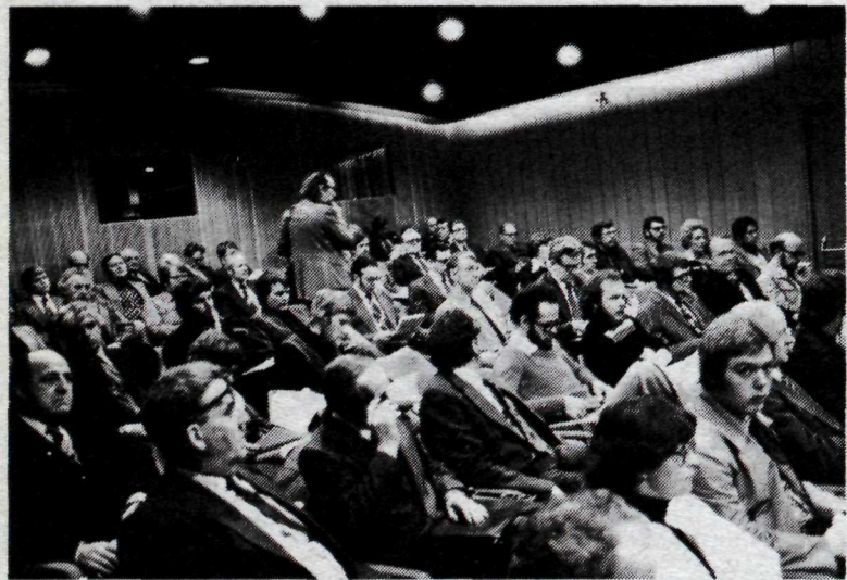
Frá ráðstefnu Landverndar um útilíf.

einstakra auðlinda eða landsgæða, hvort heldur væri til lands eða sjávar, í því skyni að fá yfirlit um inntak þeirra og umræður um það, hvernig nýta bæri auðlindir þær, sem þjóðin á og ræður yfir, án þess að grundvelli þeirra eða uppsprettum væri spillt. Varð næsta skref Landverndar á þessum vettvangi, að hlutast til um að efnt var til ráðstefnu í nóvember 1975 um fæðubúskap Íslendinga.