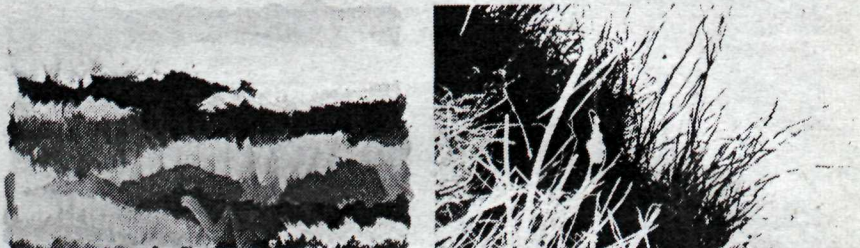
Ein myndanna á sýningunni — Teikning eftir Kerry Kennedy