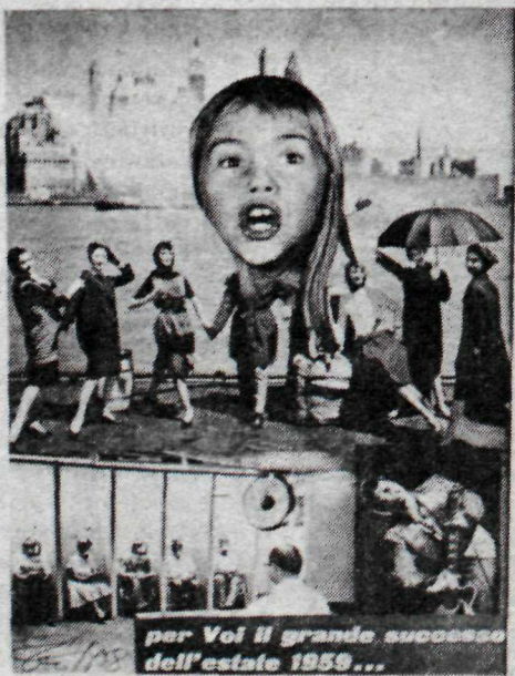
Ein af myndum Flóka ERRO.

Keppnin fer fram á þann hátt að leikirnir eru sendir milli landa með fjarrita. A keppnisstöðunum á Íslandi og í Finnlandi verða staddir fulltrúar andstæðingsins til að fylgjast með því að allt fari eftir settum reglum.