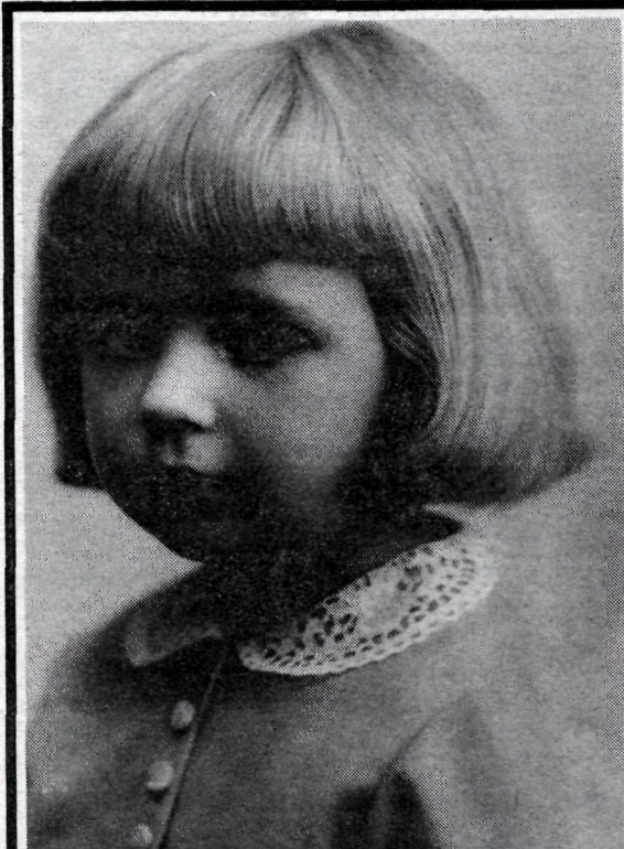
Óþekkt stúlka, myndin er frá um 1930.