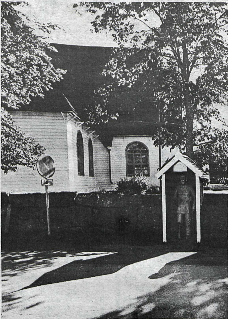
Ölmusumennirnir standa við kirkjur með framréttar hendur, gjarnan í tiltlum skýlum eins og á þessari mynd.