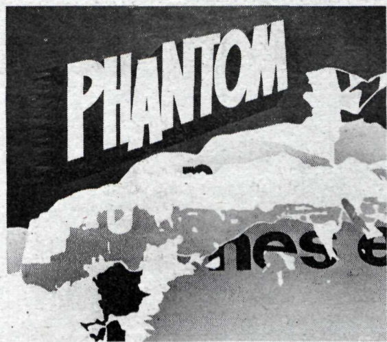
Ein af myndum Guðbergs Auðunssonar.

Afraksturinn á að ganga til námsferðar 4. stigs vélskólanema en það eru þeir sem standa fyrir flóamarkaðnum.