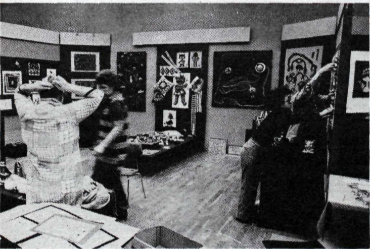
Í gær var unnið að lokaundirbúningi fyrir sýninguna á Kjarvalsstöðum.

Í dag, laugardag, er hún opin kl. 17–22 en aðra daga kl. 14–22. Á páskadag kl. 15–22 en hún er lokað á föstudaginn langa.