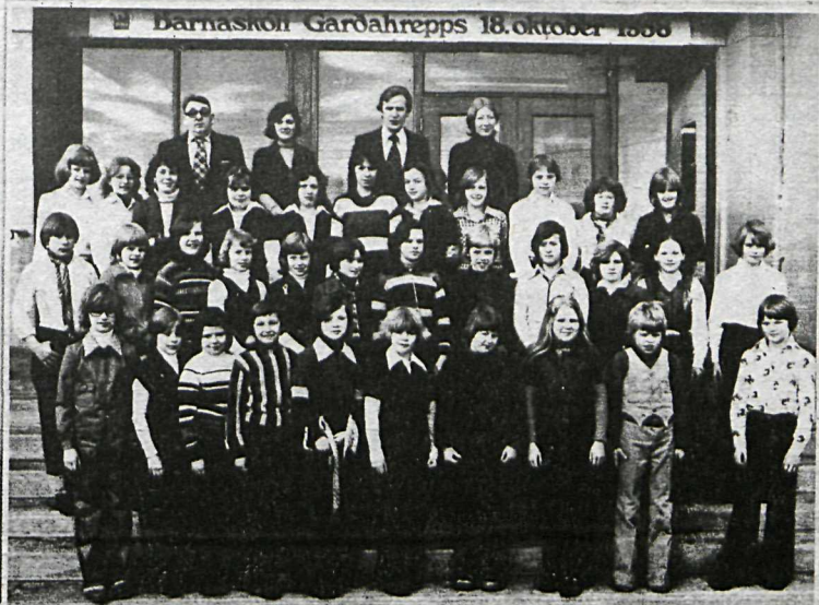
Færeyjafarar 1977. Kórinn ásamt stjórnendum, planóleikara og skólástjóra.