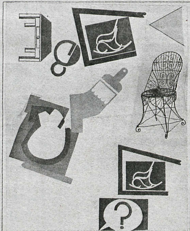
Mynd eftir Sigurð Örlygsson.