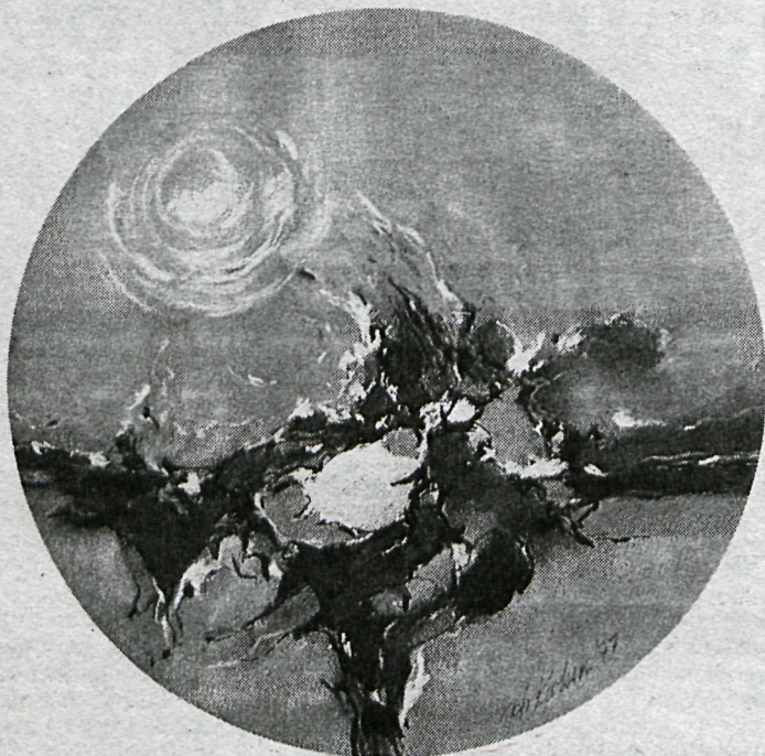
Málverk eftir Hörð Karlsson

Ný tækni skilar myndlistinni fram. Þó verður ávallt nokkur vandi að meta höfundarétt. Margir tala um að t.d. offset-grafík sé ekki grafík, en þessi leið var oft — og er — notuð til þess að fjölfalda og útbreiða collage-myndir. Tækni Sigurð-