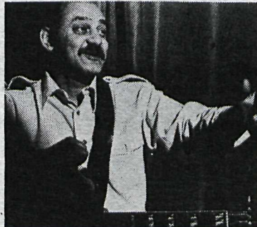
Joe Pass gítarleikari.

Peterson er fæddur í Kanada árið 1925. Þegar hann var 6 ára hóf hann að leika á trompet en varð að hætta því vegna berklaiveiki. Þá tók pianóið við. Aðeins 14 ára hafði hann útvarpsþátt einu sinni í viku og hafði þá þegar unnið til verðlauna. Á síðustu árum hefur Peterson samið æ meira af verkum til flutn-