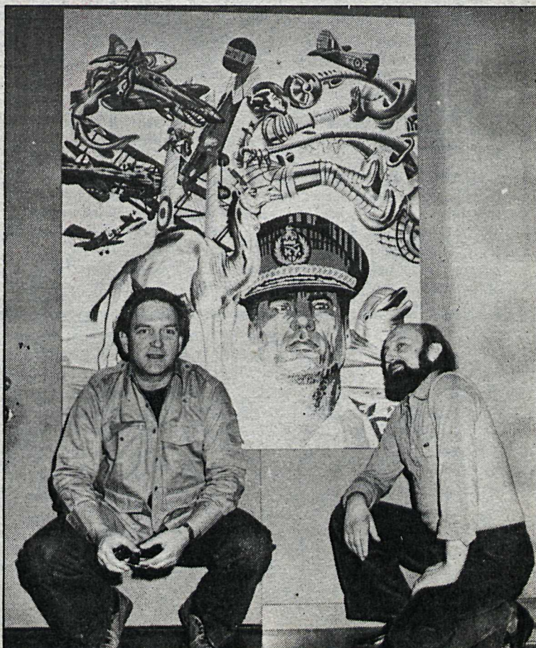
Erró, til vinstri, ásamt aðstoðarmanni við uppsetningu sýningarinnar miklu á Kjarvalsstöðum.

Zaccarelli skoraði sigurmark Ítala á 54. mín. en hann kom inn á sem vara- maður fyrir Antognoni í byrjun s.h. Frakkar reyndu mjög að jafna. Dalger átti spyrnu rétt yfir þverslá og Lacombe skallaði rétt fram hjá. En allt kom fyrir ekki. Ítalir sigruðu til mikillar ánægju fyrir 45 þúsund áhorfendur. sem nær allir voru á þeirra bandi. — hslm.