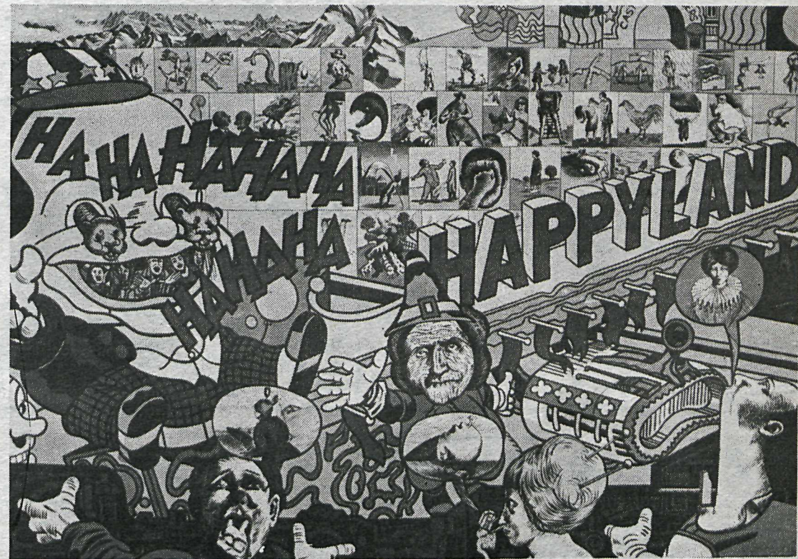
Ha, ha, ha-hamingjuland.

en þá kom lögreglustjóri auga á það að í einu horni hennar voru einhverjar verur við hið óguðlega athæfi sem, eins og hann sagði „almennur nefnir 69“ og bannaði hann myndina í Milanó. Þetta varð mikill blaðamatúr. Ég gerði síðar aðra mynd með a.m.k. sextíu og níu verum í sextíu og níu iðkun og sendi honum ljósmyndina. Nú, um páfamyndina er lítið að segja. Ég hafði málað Jóhannes páfa við hlið naktar konu eftir Modigliani og þegar átti að sýna hana í Róm, bannaði Vatíkanið hana. Hún var tekin út af