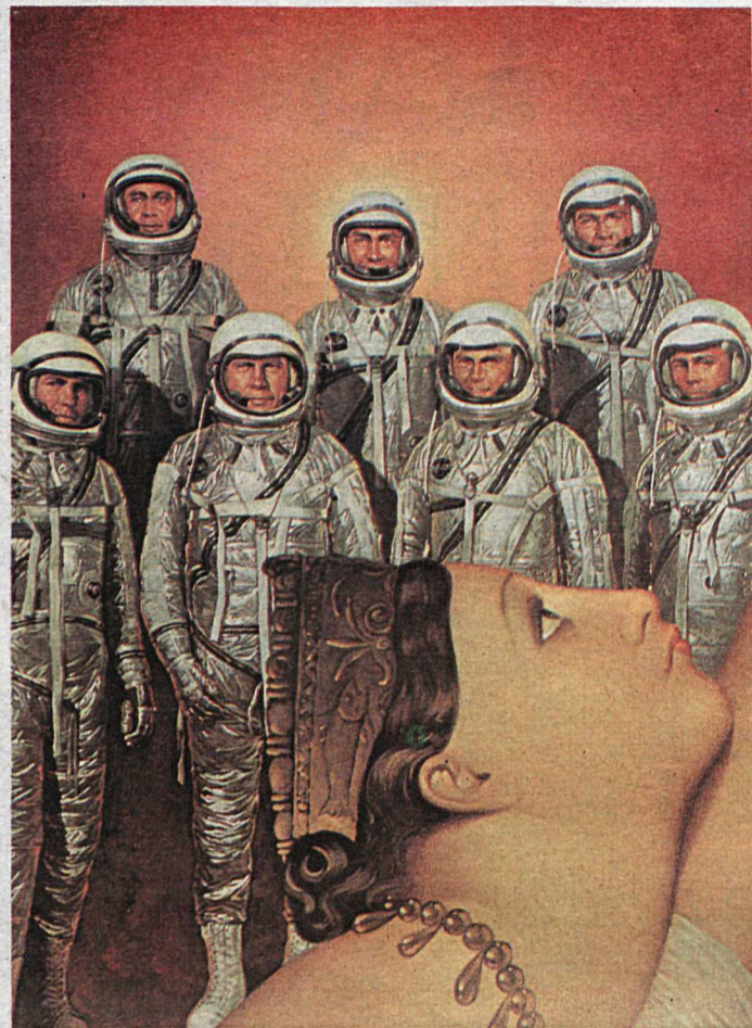
Ham, 97x64 cm, 1974.

„Það eru nær tvö ár síðan ég fór að hugleiða möguleikann á að Iceland Review gæfi út bók um Erró og í upphafi ráðfærði ég mig við Matthías Johannesen, sem er einn af fáum Íslendingum sem jafnan hefur haldið sambandi við hann ytra — og stöku sinnum á umliðnum árum hafa birzt greinar eða viðtöl, sem Matthías hefur skrifað um listamanninn. Ég setti mig í samband við Erró og lagði málið fyrir hann. Hann var mjög ánægður með framtakið og sérstaklega samvinnugóður, valdi sjálfur myndirnar, setti þær í rétta tímaröð — og útvegaði litfilmur af