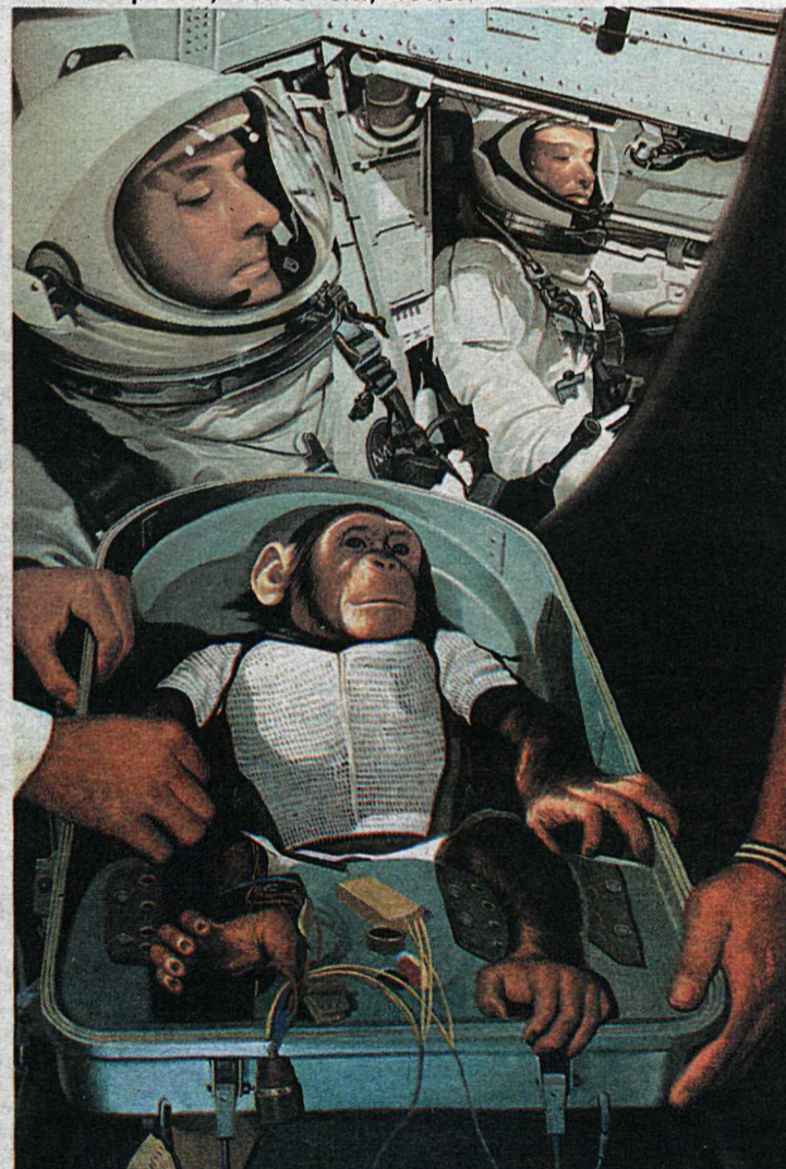
Tethis Special, 69x97 cm, 1976.