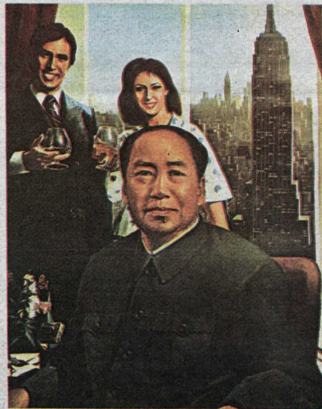
New-Yorkskrifstofan, 100x74 cm, 1976, ein af mörgum myndum Errós, þar sem Mao formaður kemur við sögu.