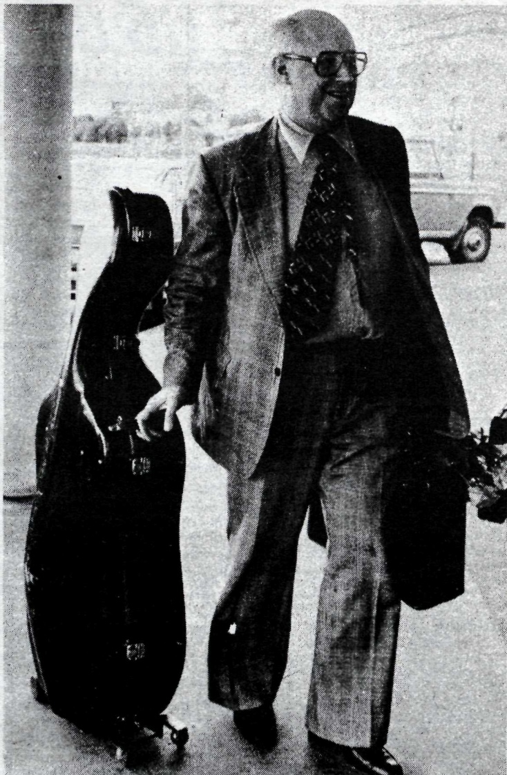
Þetta þótti mér „ljósmynd Listahátíðar“. Hér er Viatoslav Rostropovitch mættur til leiks, — brosandí, galvaskur með sellókassann sinn á hjólum. Persónugerfingur snilldarinnar er treystir á eigin mátt og megin. Hér eru engin 20 tonn af hjálpartækjum í farangrinum né 15–20 aðstoðarmenn! Einungis reffilegur og kímínleitur stórsníllingur.

a.m.k. er komið var aftur til Parísar og síðan, er hann hefur notið þess að hvílast í húsi sínu á Formentera.