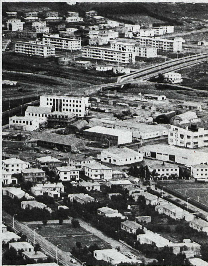
Sífelldar breytingar verða á svip Akureyrarbæjar þar sem ný hverfi bætast stöðugt við í þessum höfuðstað Norðurlands.