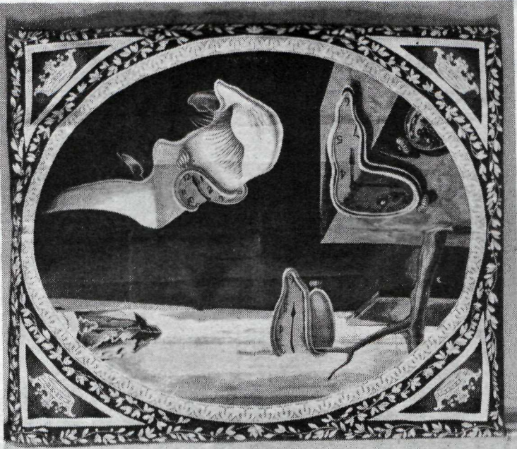
Veggteppi eftir Dali á sýningunni á Kjarvalsstöðum.