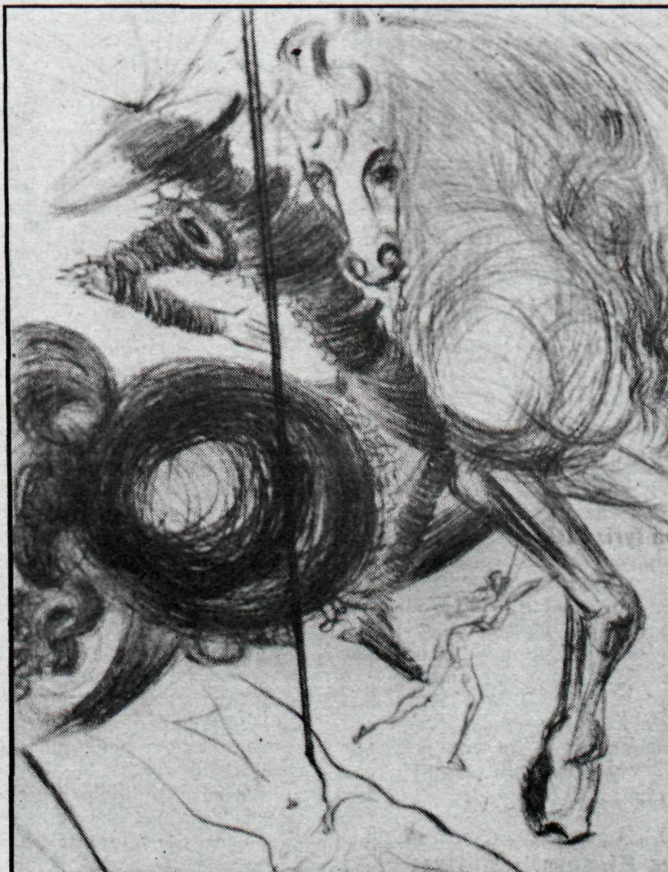
Úr myndaflokknum Decamerone.

Því er ekki að neita að list þessara ára sem hér er sýnd, frá 1960 til 1974, er ekki lengur, nema með glömpum, það sem best gerist í list Dalis. En glampar eru þar, óviðjafnanlegir. Teikningar eru þar sem bera aðalsmerki meistarara, myndsyn sem hæfir skáldflugi Dantes, blautlegum ísmeygileik Boccaccios og heiði Tristan-kvæðis. Því er það mikill fengur okkur, sem nú eigum þess kost, að dveljast um stund í nálægð þessa aldna meistarara og guðdómlega trúðleikara frá Figueras.“