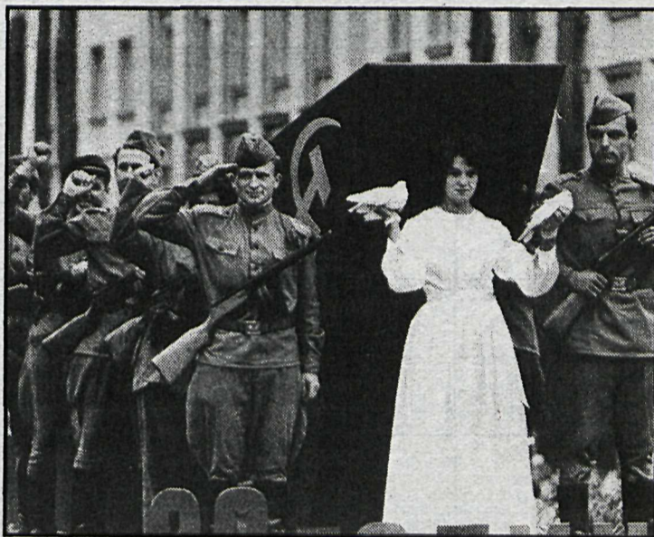
Myndir af sýningunni.

Og það gerir hún sannarlega. Þar koma deildarskiptingar sýningarinnar að gagni og hinir ýmsu flokkar verða stundum eins og heillegir og skáldlegir bálkar, þrátt fyrir það að ljósmyndar-