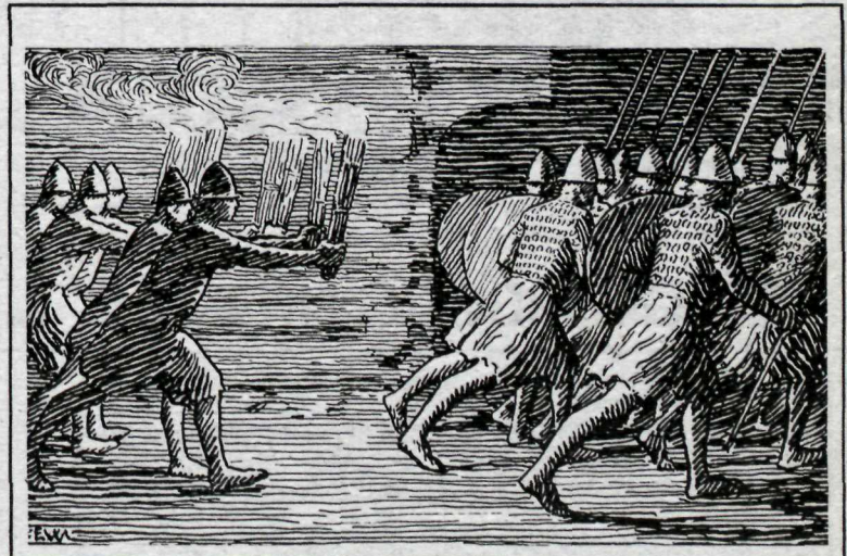
Þrjár myndir er sýna þróunina í línutækni Erik Werenskiöld's