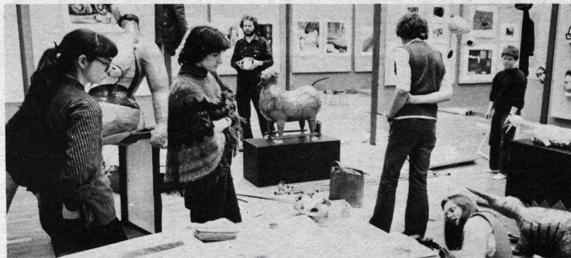
Hér var ekki setið auðum höndum. Uppsetning sýningarinnar var á fimmtudaginn í fullum gangi og auðséd var að nemendum var annað um að öllu yrði vel fyrir komið.