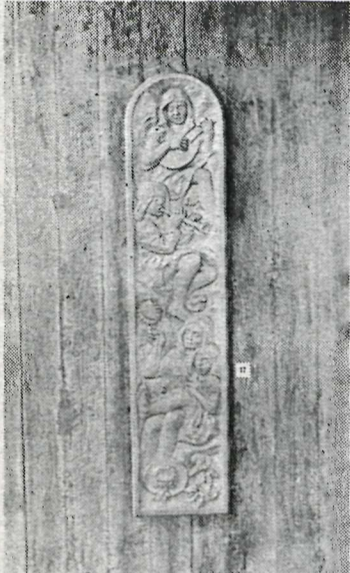
Útskurður eftir Kurt Zier.

Þaðan lá leiðin í Stýrimannaskólann við Öldugötu, síðan á Grundar-