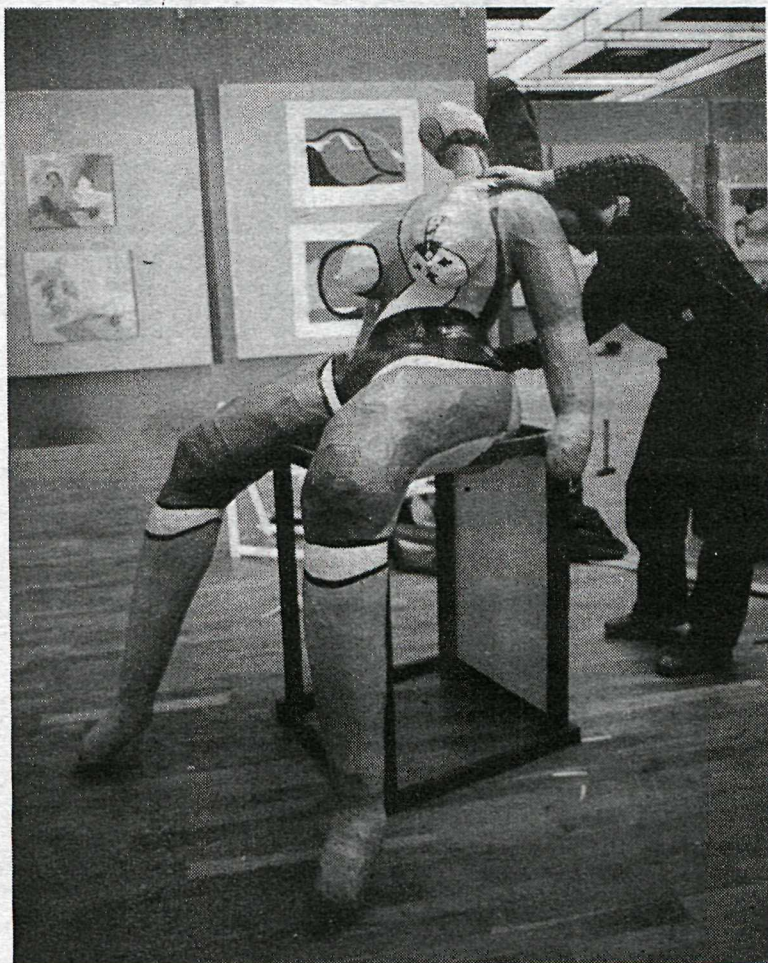
Í salnum sem kenndur er við meistara Kjarval situr þessi myndarlega valkyrja.