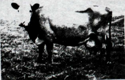
45. Húfa 33, Gröf.

Forkur var felldur 5. sept. 1978 eftir að tilskildu sæðismagni hafði verið náð úr honum. Í septemberlok var búið að senda út til dreifingar 1121 skammt.