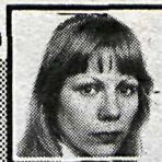
Umsjón: Katrín Pálsdóttir