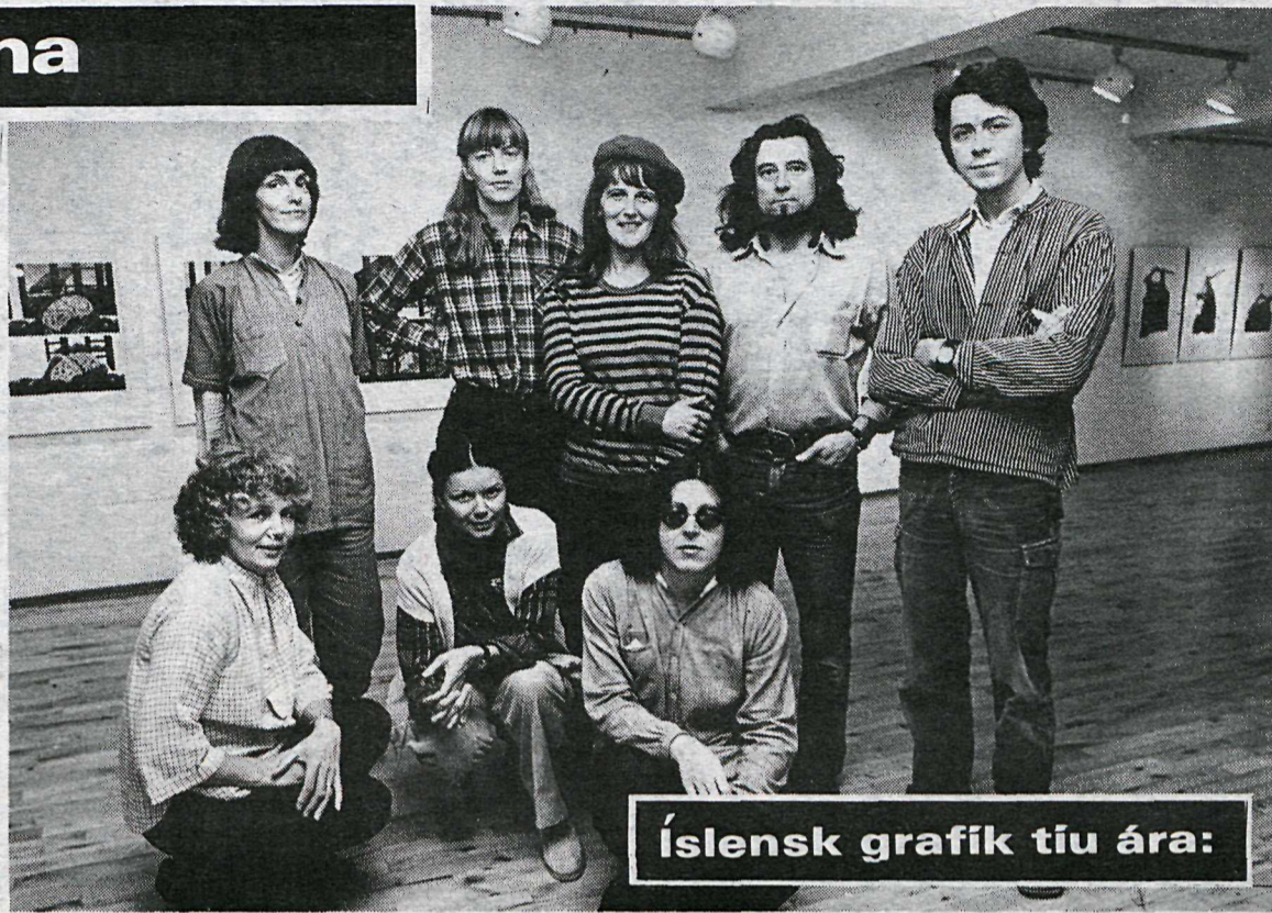
Íslensk grafík tíu ára: