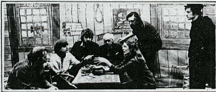
Frá sýningu leiktjaldasmíða á Kjarvalsstöðum.

þær glögga mynd af vinnubrögðum listamannanna. Um þróunarferil er ekki að ræða, þar sem hverjum listamanni er úthlutað afmarkað sviði og fá sýnishorn eru eftir hvern þeirra. Eins er því varið með teikningar á búningum. Aðeins fáar teikningar eru eftir hvern höfund og gefa þær því litla mynd af þróun hvers fyrir sig. Ljósmyndir fylgja sviðs-