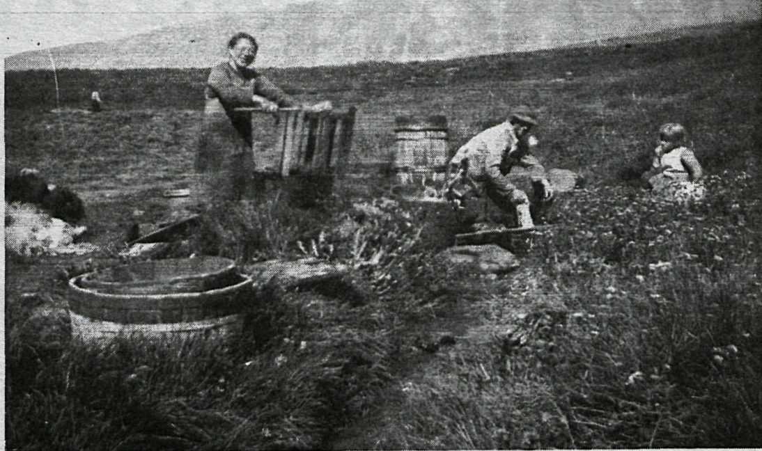
Ullarþvottur í Brimnesi í Skagafirði um 1942.