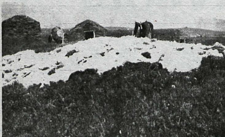
Ullin breidd til þerris í Brimnesi, Skagafirði, um 1942.

Sýningunni lýkur 21. október. Jónas Guðmundsson.