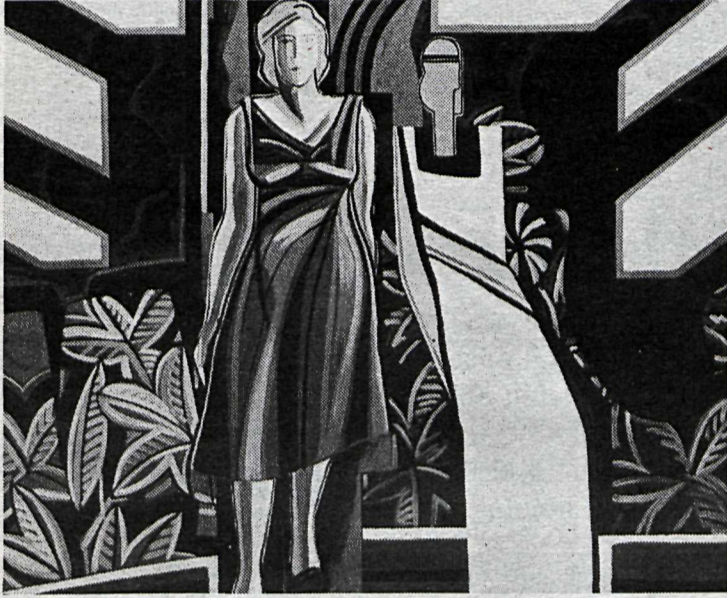
Konan í garðinum.