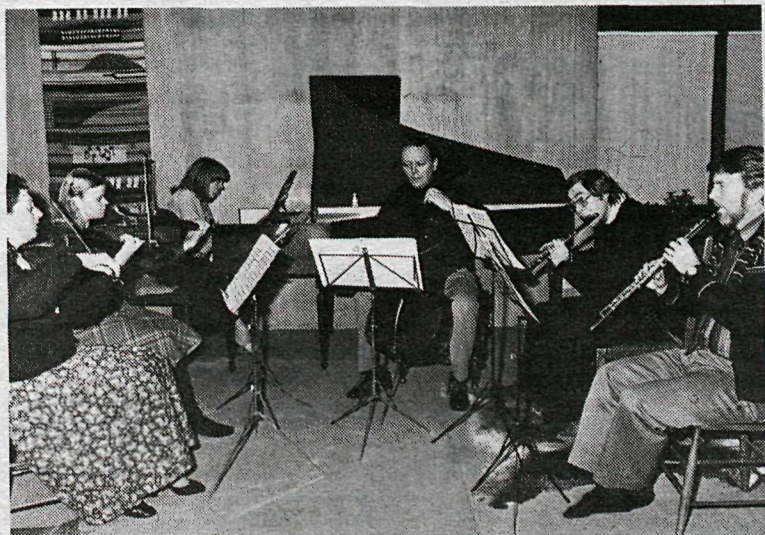
Kammersveit á æfingu

Aðgöngumiðar verða seldir við innganginn.