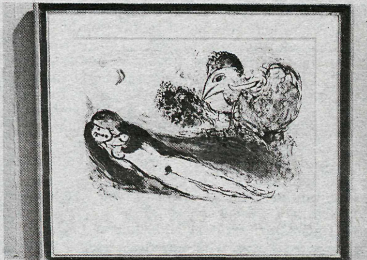
Ein Chagall-myndanna á sýningunni

Litla Leikfélagið er einnig að hefja æfingar á Barnaleikriti. Það heitir „Spegilmaðurinn“ eftir Brian Way og er það þýtt af félögum leikfélagsins og verður því frumflutt hér á landi. Leikritið er hins vegar mjög auðvelt í uppsetningu og er nýstárlegt að því leyti að það er leikið á gólfinu á meðal áhorfenda, sem fá að taka þátt í leiknum og er þá miðað við áhorfendur á aldrinum 4ra — 10 ára. Ætla félagsmenn sjálfir að leikstýra þessu verki í hópvinnu og er stefnt að frumsýningu í febrúar.