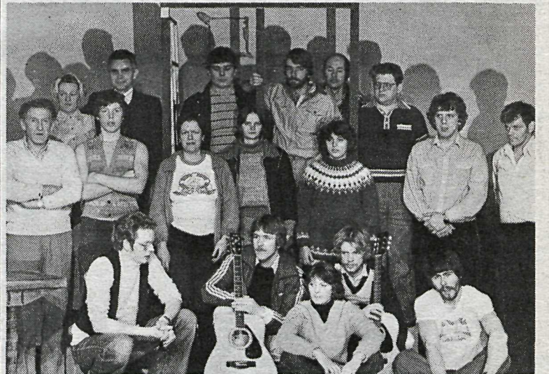
Litla leikfélagið í Garðinum tekst á hendur víðamikilværfekni, en félagið sýnir um þessar mundir Þið munið hann Jörund. Myndin er af aðstandendum sýningarinnar.